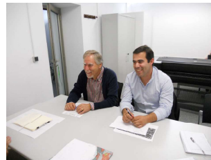
S.C. Misericórdia Vale de Cambra