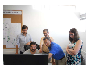
União de Freguesias de Codal, Vila Chã e Vila Cova de Perrinho