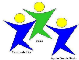
Cpspj Baptista de Cepelos